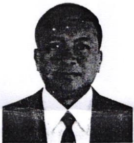
๕. พลเอก นิพัทธ์ ทองเล็ก อดีตปลัดกระทรวงกลาโหม