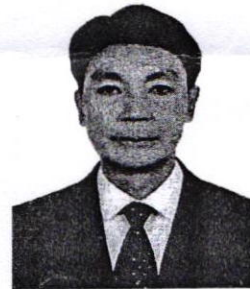
๔. นายกมลินทร์ พิณีจوادล อดีตผู้อำนวยการสถาบันระหว่างประเทศ เพื่อการค้าและการพัฒนา (องค์การมหาชน)