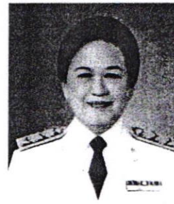
๔. นางจันทร์ทอง อุนากุล อดีตเอกอัครราชทูต ณ กรุงบูดาเปสต์ ประเทศฮังการี