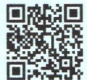
สแกน QR Code

① ฝ่ายรับนักศึกษา 0 2504 - 7213 ① ศูนย์บริการร่วมครบวงจร ONE STOP SERVICE อาคารบริการ 1 ชั้น 1 มสธ.