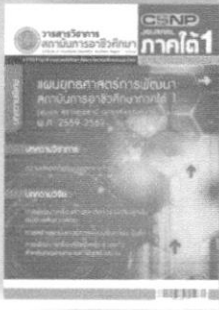
ปีที่ 1 ฉบับที่ 1

การวิจัยด้านอาชีวและเทคนิคศึกษา พัฒนานวัตกรรมเพื่อชุมชนและสังคม