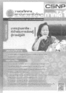
ปีที่ 4 ฉบับที่ 1