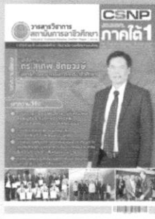
ปีที่ 3 ฉบับที่ 2