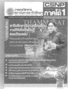
ปีที่ 4 ฉบับที่ 2