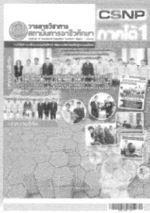
ปีที่ 3 ฉบับที่ 1