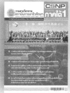
ปีที่ 2 ฉบับที่ 2